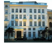
Dat Hoghehus, Koberg