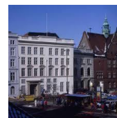
Dat Hoghehus, Koberg 2