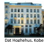
Dat Hoghehus, Koberg