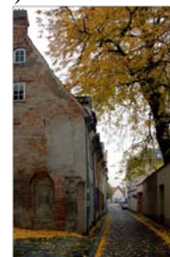
Herbstliches Gässchen in Lübeck